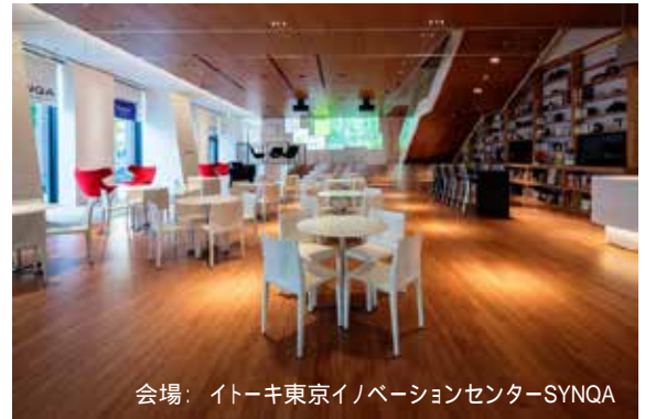
会場: イトーキ東京イノベーションセンター-SYNQA