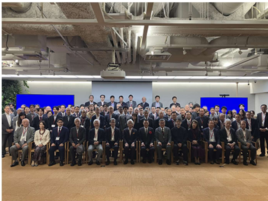
10月24日(木) CSV 中間報告会+セミナー